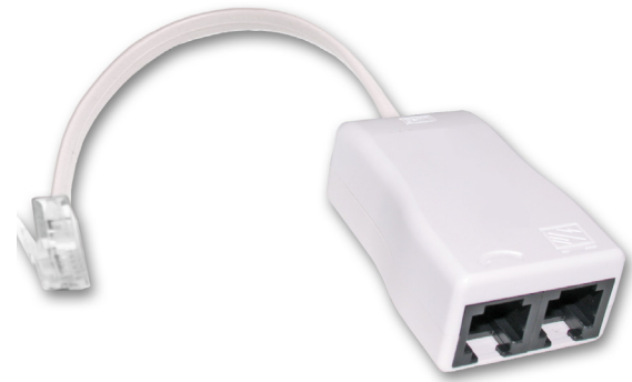
Z-369P2J microfiltro residencial ADSL